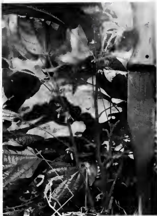
Ph. 1. — Epinetrum cordifolium G. Mangenot et J. Miège : Pied ♂.